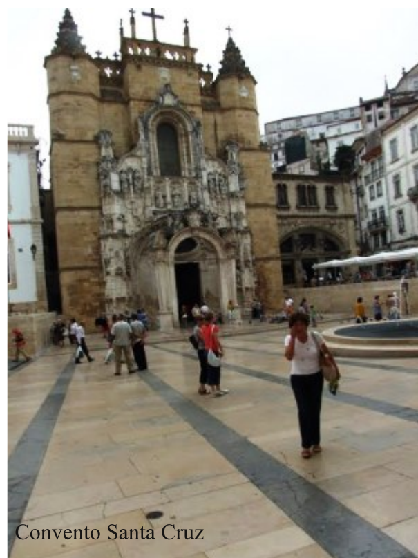
Convento Santa Cruz