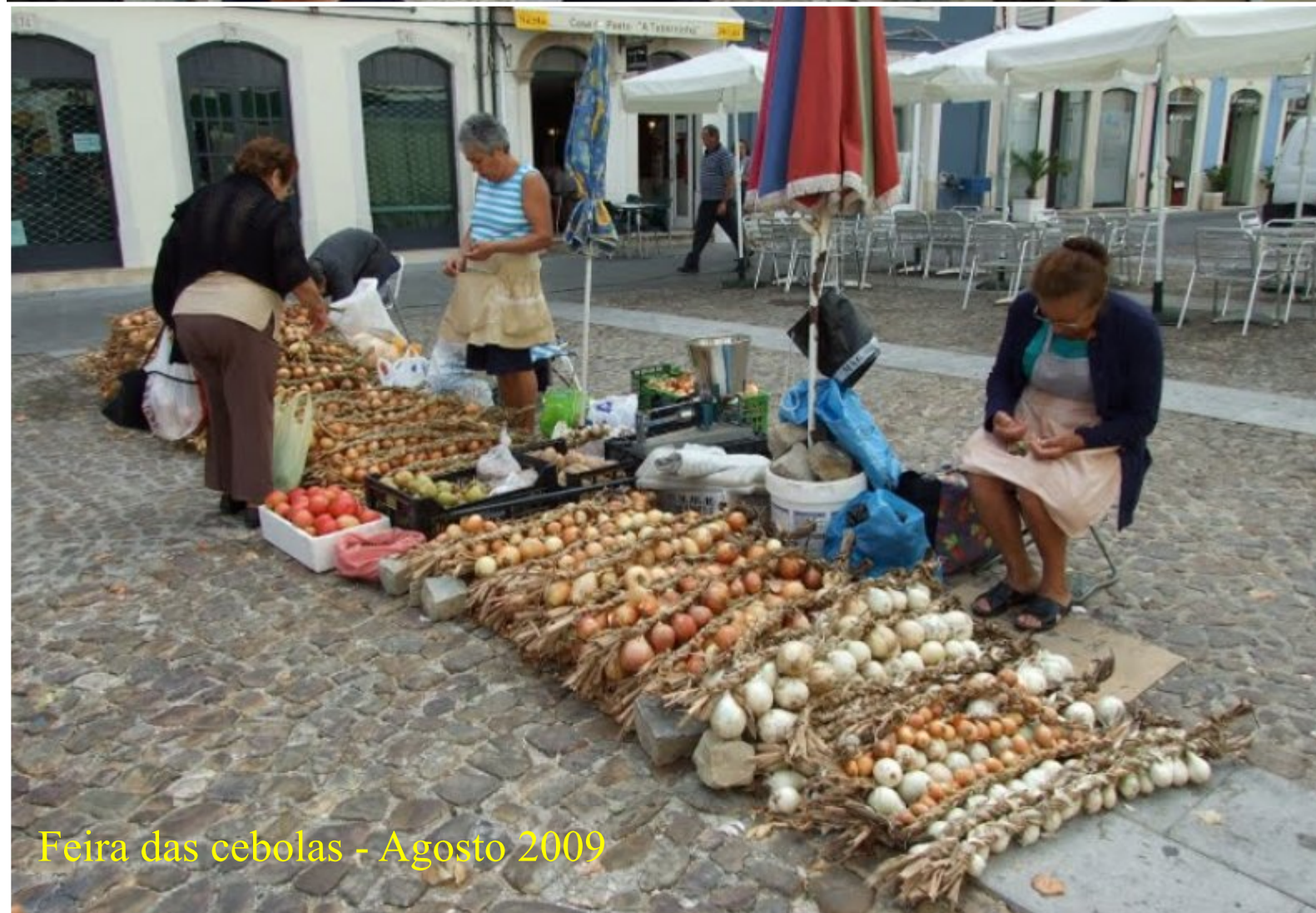
Feira das cebolas - Agosto 2009