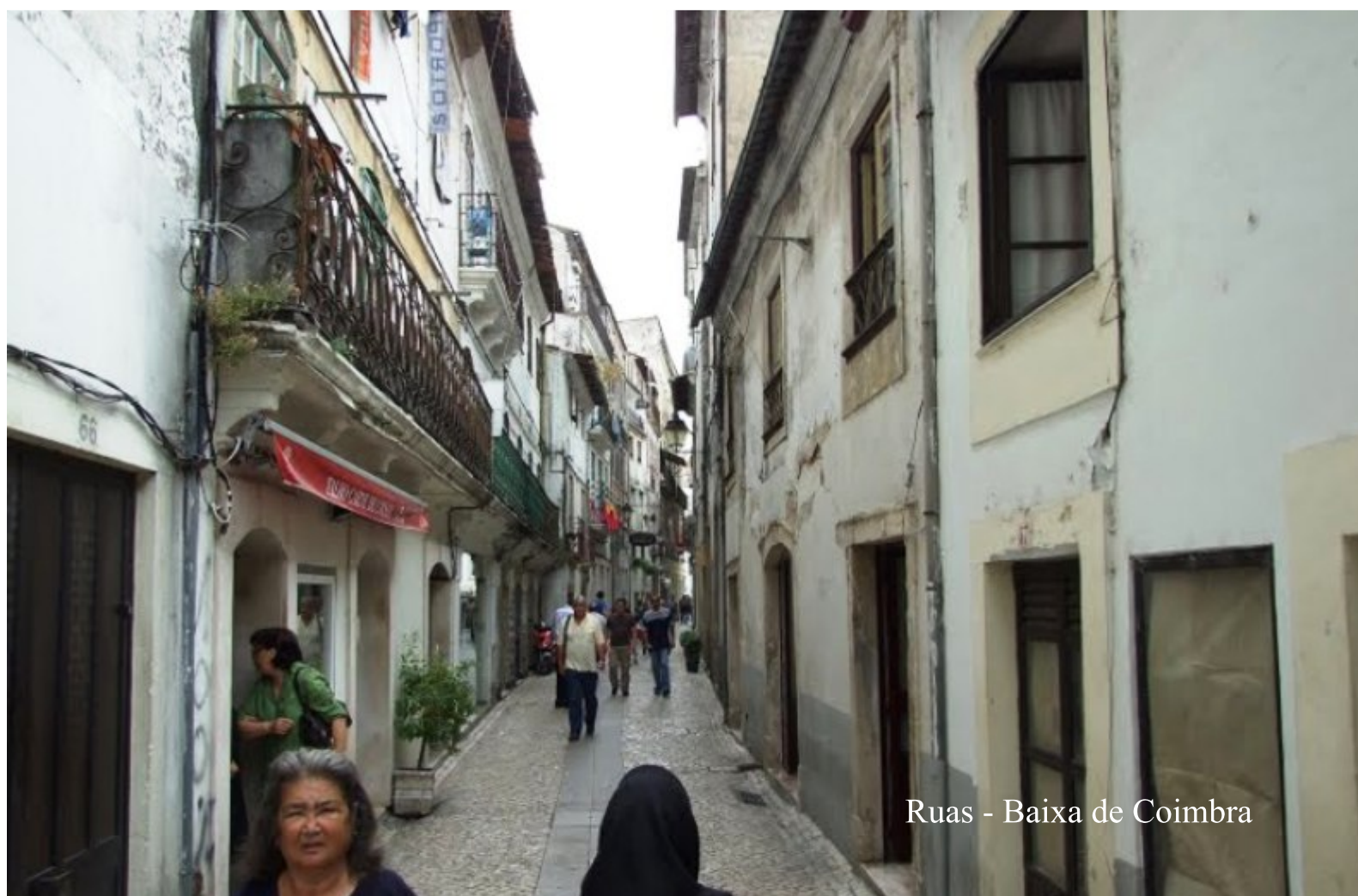
Ruas - Baixa de Coimbra